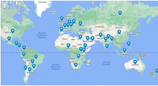
Redes nacionales de empresas y discapacidad que son miembro de la Red Mundial de Empresas y Discapacidad de la OIT

Las redes nacionales de empresas y discapacidad miembro de la GBDN de la OIT han establecido vínculos más estrechos con las redes locales del Pacto Mundial en sus respectivos países. Por ejemplo, en 2023, la Red de Empresas y Discapacidad de Bangladesh firmó un memorando de entendimiento con la organización CSR Centre, el coordinador conjunto del Pacto Mundial de Bangladesh.